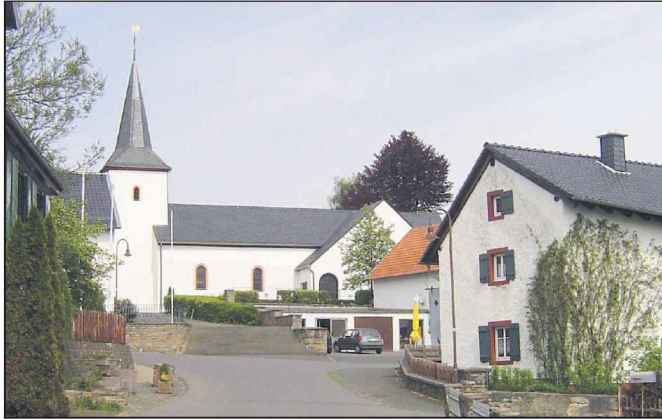
In der Pfarrkirche St. Mariä Himmelfahrt Uedelhoven findet ein Gospel-Konzert der Extraklasse statt.